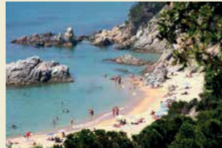
Cala Sa Boadella