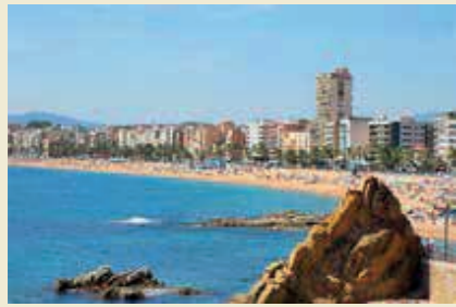
Lloret de Mar