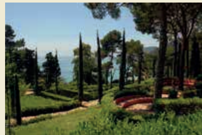
Jardins de Santa Clotilde