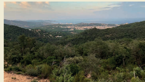
Massís de Ses Cadiretes