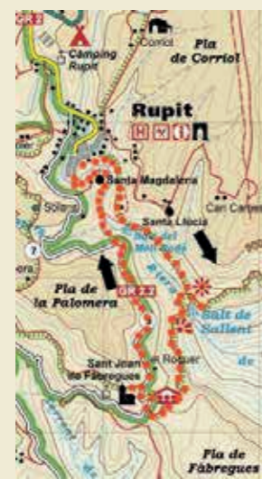
Ruta Salt de Sallent