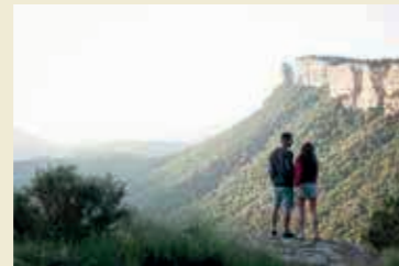
Salt de Sallent