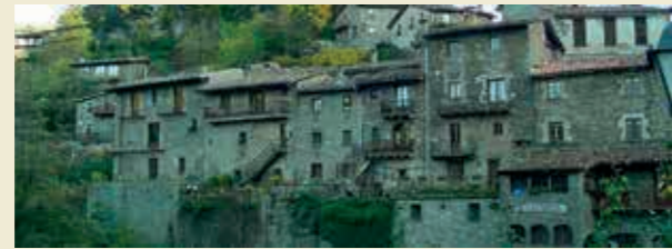
Rutes a peu i amb bicicleta des del camping