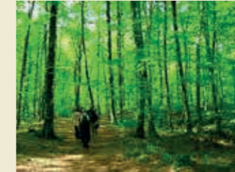
Fageda d'en Jordà