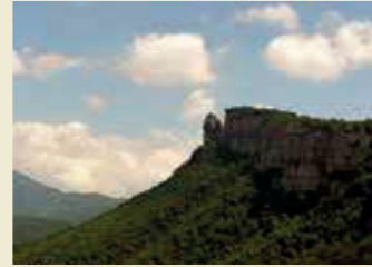
Monument natural l' Agullola