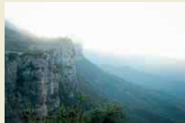
Cinglera de Collsacabra