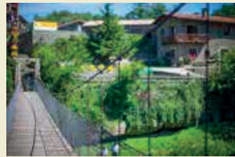
Rupit i Pruit