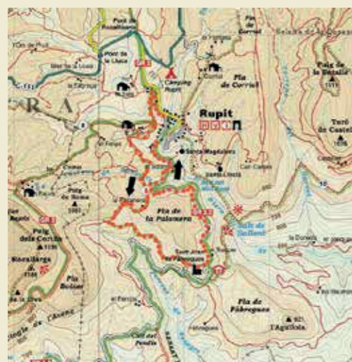
Ruta Sant Joan de Fàbregues